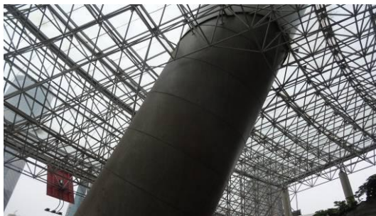
东方明珠南侧斜筒体筒壁外表面现状