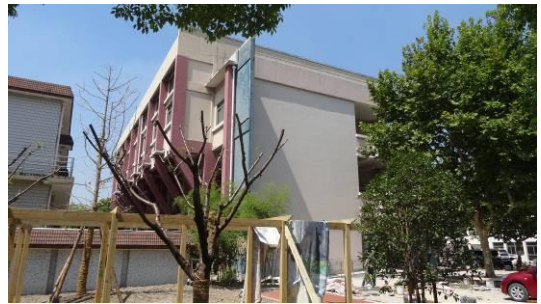
七宝明强小学体育活动中心南立面