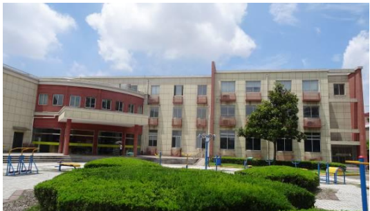
七宝镇文体分中心大楼东立面 1