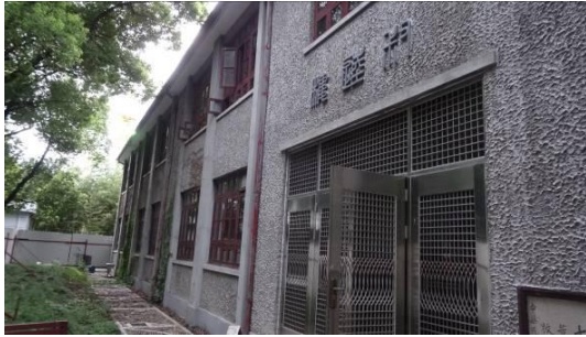
七宝二中叔逵楼南立面 2