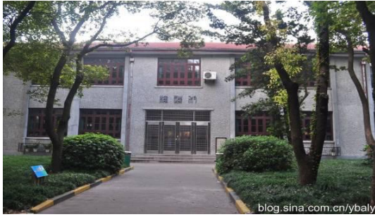
七宝二中叔逵楼房屋主入口