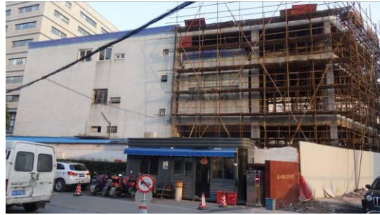
合川路 3125 号房屋北立面