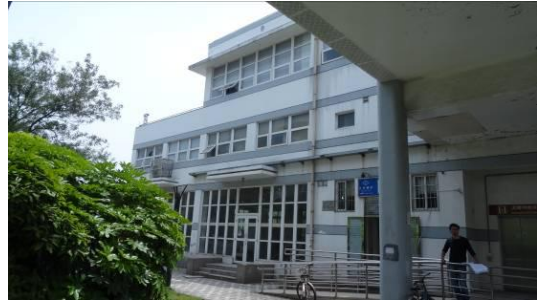
5 号线华宁路站路侧用房