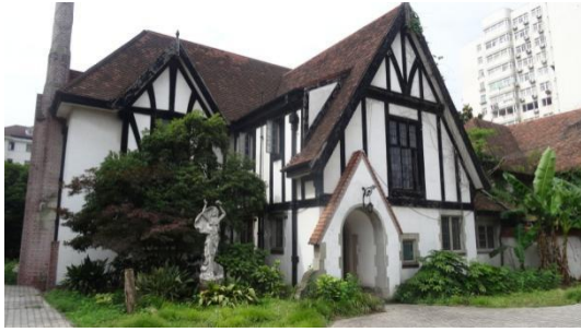
虹桥路 2310 号房屋北立面