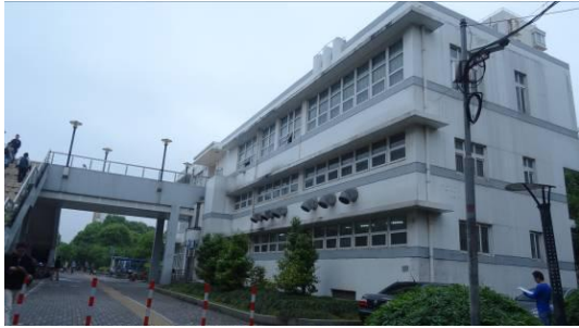
5 号线金平路站路侧用房