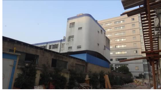
合川路 3125 号房屋南立面 1