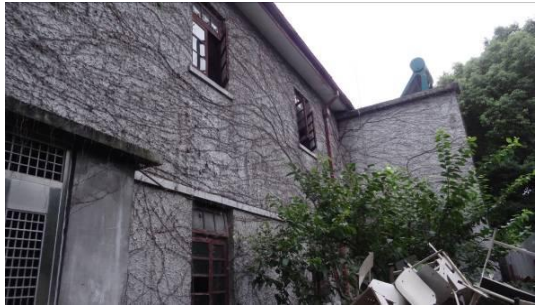
七宝二中叔逵楼北立面 3