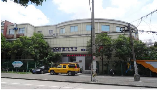
七宝镇文体分中心大楼西立面 1