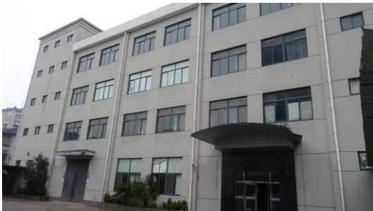
中春路 7039 弄 88 号 2 号楼南立面