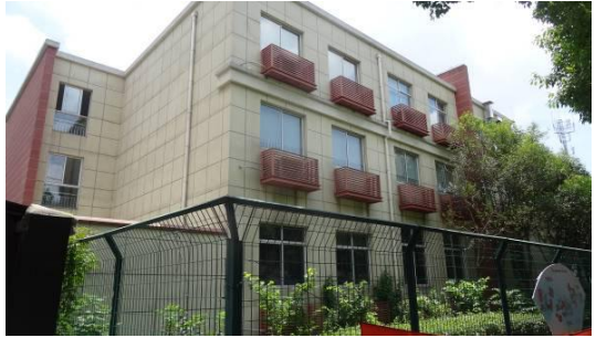
七宝镇文体分中心大楼西立面 2