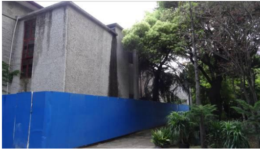
七宝二中叔逵楼北立面 2