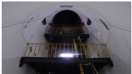
东方明珠南侧斜筒体内部现状