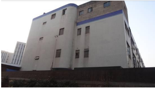
合川路 3125 号房屋南立面 2