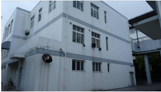
5 号线文井路站路侧用房