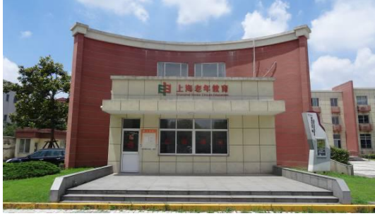
七宝镇文体分中心大楼东立面 2