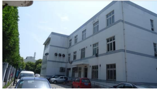
5 号线闵行开发区站路侧用房