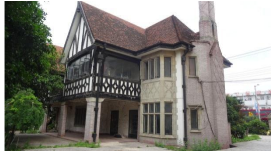
虹桥路 2310 号房屋南立面