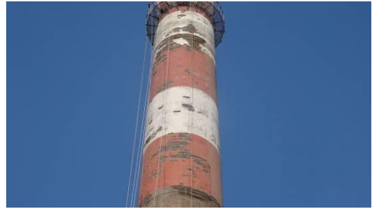
烟囱外筒壁现状 1（航标线以上部分）