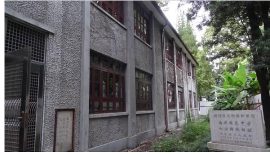
七宝二中叔逵楼南立面 1