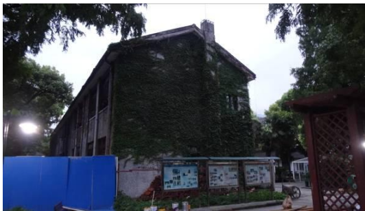
七宝二中叔逵楼东立面