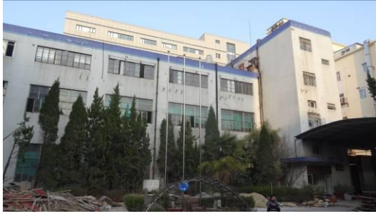
合川路 3125 号房屋西立面