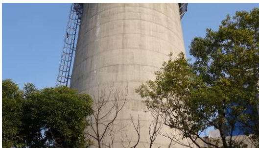
烟囱外筒壁现状 2（中部）