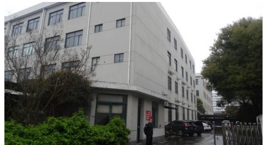
中春路 7039 弄 88 号 2 号楼东立面