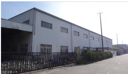
安亭木器厂南立面