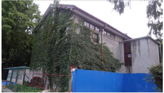
七宝二中叔逵楼北立面 1