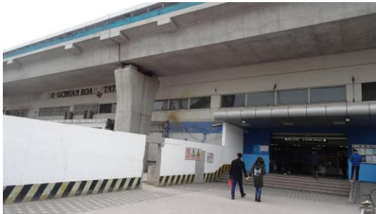
5 号线东川路站主出入口