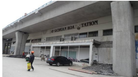
5 号线东川路站西立面