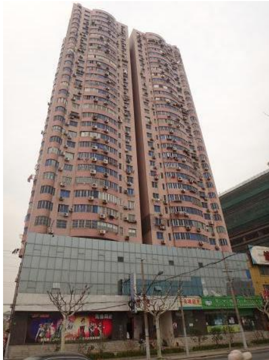
申汉小区 A 座南立面