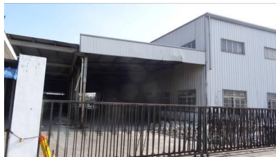
安亭木器厂西立面