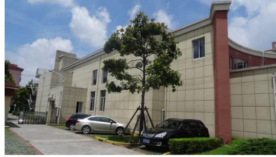
七宝镇文体分中心大楼南立面