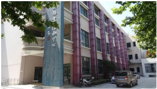
七宝明强小学体育活动中心北立面