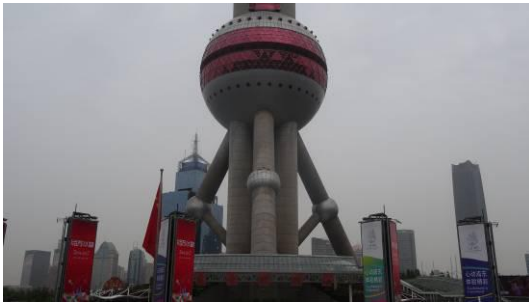
东方明珠南侧斜筒体立面 1