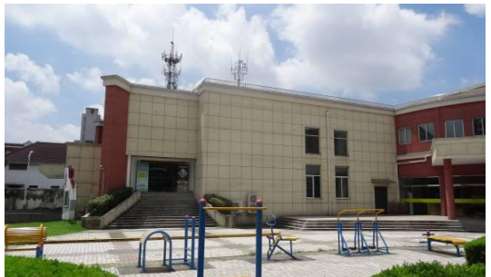
七宝镇文体分中心大楼北立面 1