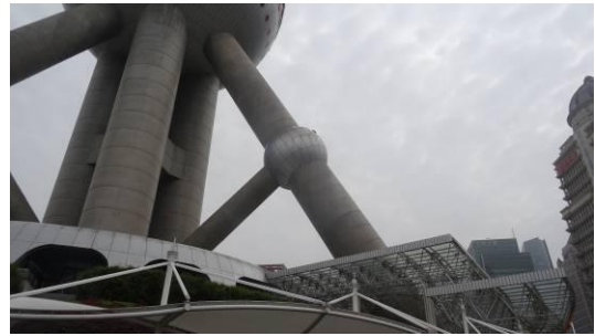
东方明珠南侧斜筒体立面 2